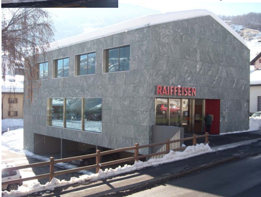
↓ Elévation angle Nord-Est