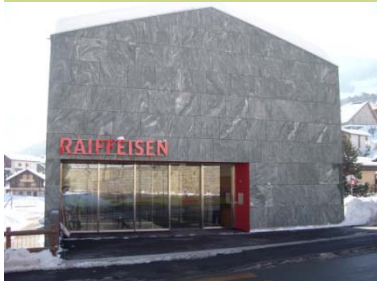
← Elévation façade Nord