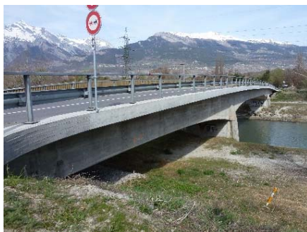
Nouvelle bordure coté Brigue