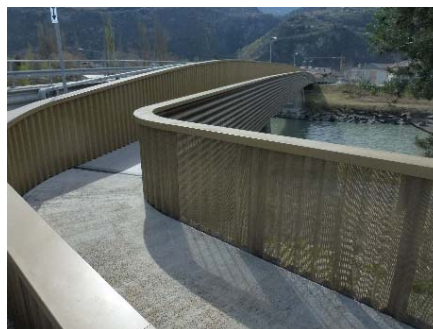
Vue de la passerelle fixée sur l'ouvrage