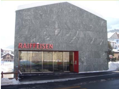
← Elévation façade Nord