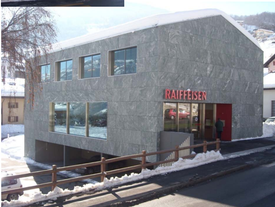
↓ Elévation angle Nord-Est